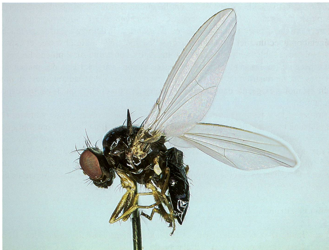
Fig. 1. Adulte de Camilla glabra (Fallén, 1823).