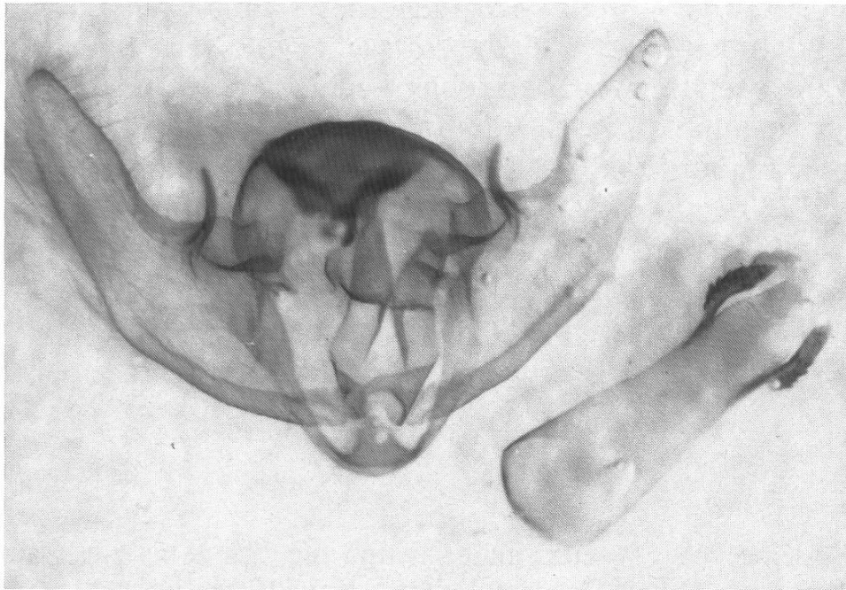
Abb. 3. Ch. intermedia : ♂ Genital, Chur, 7.1930, coll. THOMANN, Naturmuseum Chur.

nen schon rein äusserlich als zu Ch. glaucinaria gehörend, was Genitalpräparate in beiden Fällen bestätigten.