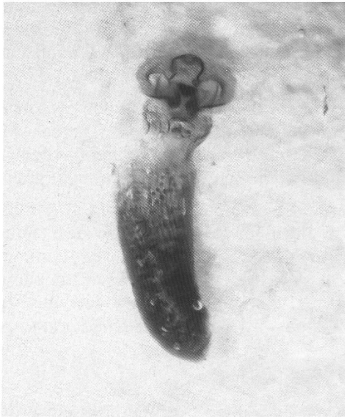
Abb. 2. Ch. intermedia : ♀ Genital, Simplon, 13.7.06, coll. VORBRÖDT, Naturhistorisches Museum Bern.

dem Hinweis auf die Abbildung in WEHRLI'S Arbeit von 1921. Es erwies sich als Charissa intermedia (WEHRLI) ♀ (Gen. Präp. 14/10/94-1, JS) (Abb.2). Das zweite Tier, ein ♀ aus Twannberg, Bieler Jura, 11.6.09 ist ebenfalls Charissa intermedia (WEHRLI). Das dritte Tier, ein ♀ aus Ried, Bieler Jura 20.7.07, erwies sich als Charissa glaucinaria (HBN).