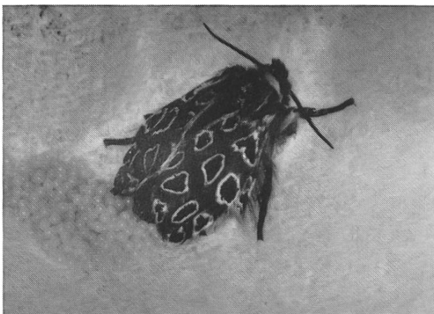
Abb. 1. Eiablage von O. parasita lianea WITT. Die Flecken auf der Vfl.O. sind bei dieser Unterart deutlich hell umrandet.

Die Eier sind blass gelblichgrün und werden haufenförmig abgelegt. Ein Gelege enthält etwa 400 Eier. Es ist sehr erstaunlich, dass die Eier der spp. lianea im Vergleich mit denjenigen aus dem Wallis und Tessin deutlich kleiner sind.