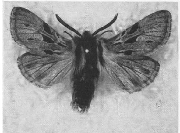
Abb. 3. O. parasita lianea WITT : Männchen mit reduzierten Flecken