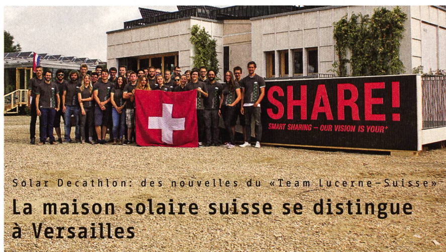
Solar Decathlon: des nouvelles du «Team Lucerne-Suisse»

Au milieu de l'année, deux pôles de compétence en recherche énergétique dans le champ d'action «Efficacité énergétique» ont commencé leurs activités. Les sept champs d'action définis dans le plan d'action «Recherche énergétique suisse coordonnée», sont ainsi couverts par des Swiss Competence Centers for Energy Research (SCCER) appropriés. Pour les années 2014 à 2016, près de 10 millions de francs seront alloués au développement des capacités de recherche et l'exploitation dans le champ d'action «Efficacité énergétique». A eux deux, les pôles couvrent les thèmes-clés du champ d'action. Le Laboratoire fédéral d'essai des matériaux et de recherche (Empa) constitue la Leading House du SCCER «Future Energy Efficient Buildings and Districts – FEEB&D», l'Ecole polytechnique fédérale de Zurich (EPFZ) celle du SCCER «Efficiency of Industrial Processes – EIP».