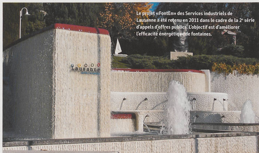
Le projet «FontEn» des Services industriels de Lausanne a été retenu en 2011 dans le cadre de la 2 e série d'appels d'offres publics. L'objectif est d'améliorer l'efficacité énergétique de fontaines.

Les trois premiers appels d'offres ont permis de soutenir 116 projets et 30 programmes qui permettent des économies d'électricité de près de 140 millions de kilowattheures par année.