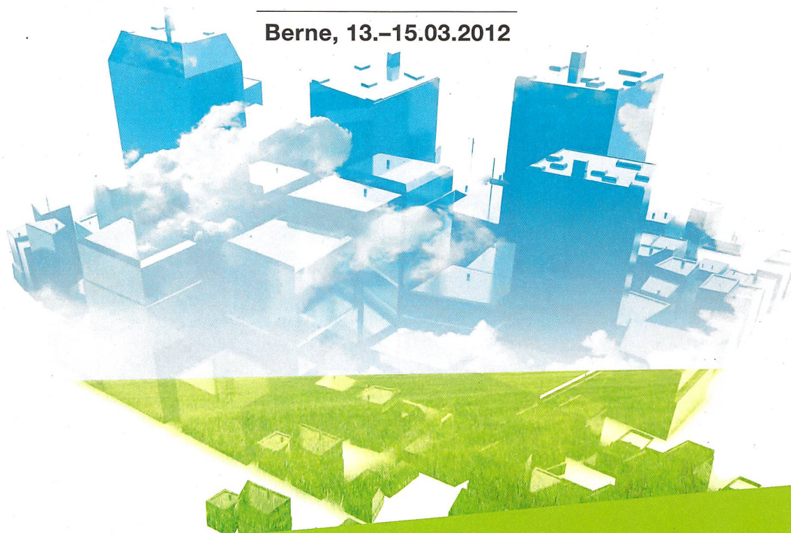
Plate-forme pour le développement durable des communes, des villes et des entreprises