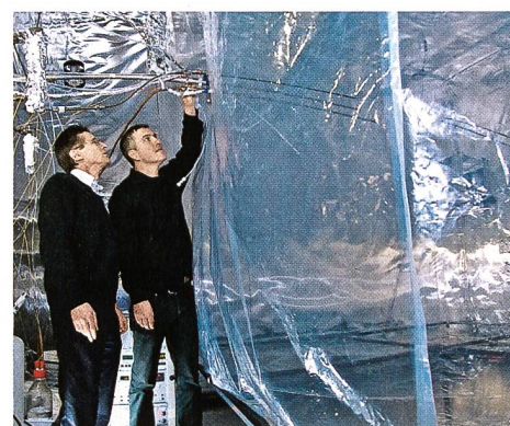
La chambre à smog de l'Institut Paul Scherrer.

LES RÉSULTATS OBTENUS PAR LE GROUPE DU PSI APPORTENT UN ÉCLAIRAGE PARTICULIÈREMENT NOUVEAU SUR LA FORMATION DES POUSSIÈRES FINES SECONDAIRES ISSUES DES CHAUFFAGES AU BOIS.