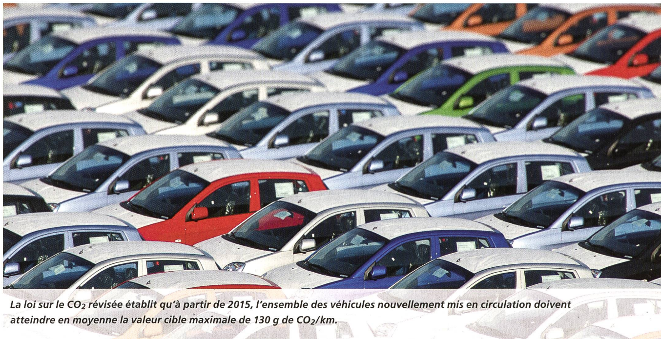
La loi sur le CO 2 révisée établit qu'à partir de 2015, l'ensemble des véhicules nouvellement mis en circulation doivent atteindre en moyenne la valeur cible maximale de 130 g de CO 2 /km.