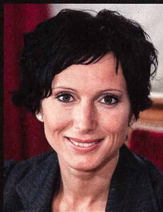
PASCALE BRUDERER, CONSEILLÈRE NATIONALE ET MEMBRE DU JURY DU WATT D'OR.