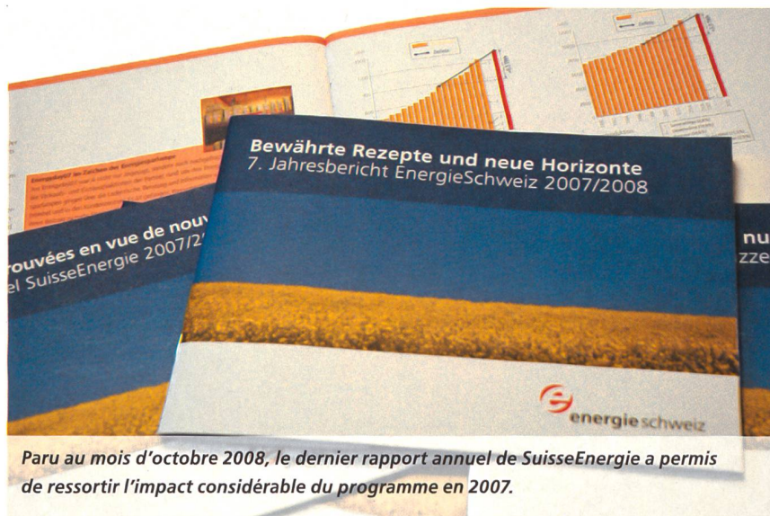
Paru au mois d'octobre 2008, le dernier rapport annuel de SuisseEnergie a permis de ressortir l'impact considérable du programme en 2007.