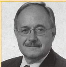
Samuel Schmid Conseiller fédéral, chef du DDPS