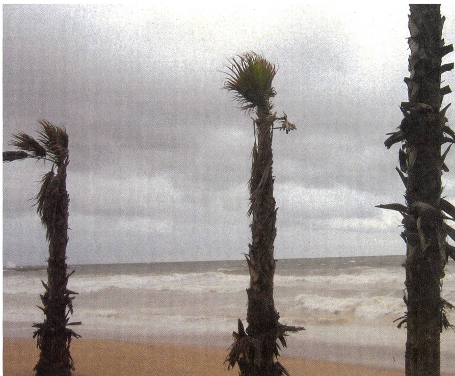
Bientôt une taxe mondiale sur le CO 2 ?

www.rand.org/research_areas/energy_environment/