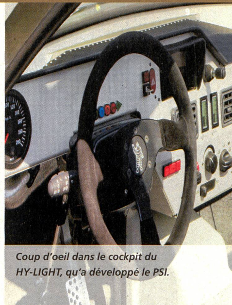
Coup d'oeil dans le cockpit du HY-LIGHT, qu'a développé le PSI.