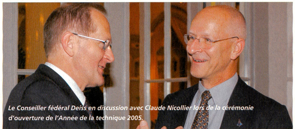
Le Conseiller fédéral Deiss en discussion avec Claude Nicollier lors de la cérémonie d'ouverture de l'Année de la technique 2005.

Contact: Année de la Technique c/o Swiss Engineering UTS 37, bd de Grancy, 1006 Lausanne Tél. 021 617 79 79 info.sr@swissengineering.ch www.annee-de-la-technique.ch