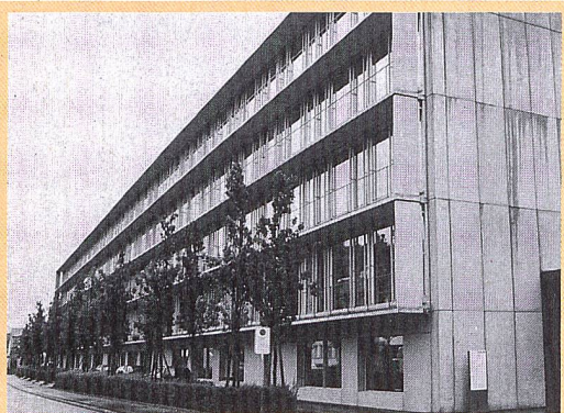
Adliswil: MINERGIE record grâce à Swiss Re

■ VEL 2 a généré un projet censé promouvoir la mobilité douce (piétons et deux-roues) et intitulé «Mendrisio dans l'air du temps». L'objectif consiste à sensibiliser les piétons et les cyclistes afin qu'ils prennent conscience du temps qu'il leur faut pour atteindre les sites les plus importants de la commune.