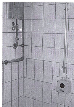
Une cellule photoélectrique dans les toilettes: 5000 m 3 d'eau économisés

couplée à une minuterie dès que le faisceau lumineux est coupé par les usagers. Les économies d'eau annuelles réalisées s'élèvent à 70%, soit 5000 mètres cubes, la consommation annuelle de plus de 80 personnes. «Les Services industriels sont même venus contrôler leur compteur, croyant qu'il était hors d'usage».