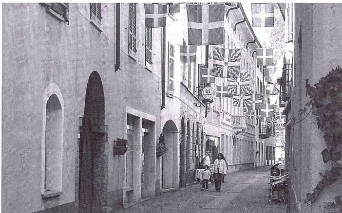
A Mendrisio, on pouvait déjà déambuler sur les pavés de la zone piétonne en 1982.

La commune tessinoise innove dans sa politique des transports.