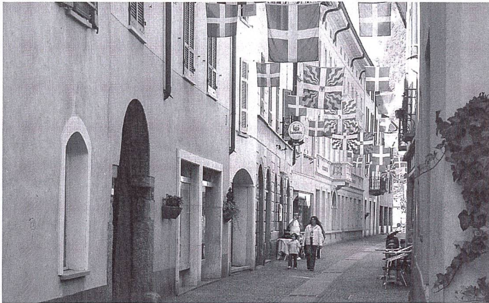
A Mendrisio, on pouvait déjà déambuler sur les pavés de la zone piétonne en 1982.

La commune tessinoise innove dans sa politique des transports.