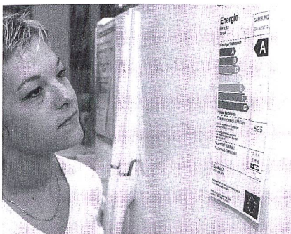
Étiquette pour appareils ménagers

Avantages. L'étiquette Énergie indique la consommation de carburant en l/100 km, l'émission de CO 2 en g/km, ainsi que la consommation relative. Elle encourage l'auto-