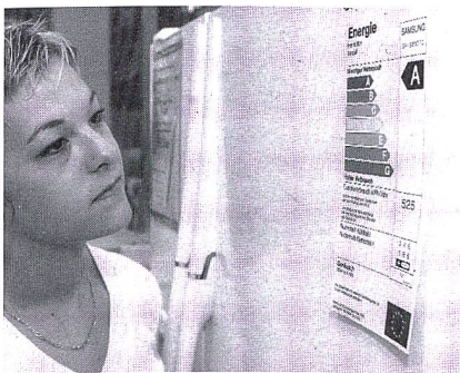
Étiquette pour appareils ménagers

Avantages. L'étiquette Énergie indique la consommation de carburant en l/100 km, l'émission de CO 2 en g/km, ainsi que la consommation relative. Elle encourage l'auto-