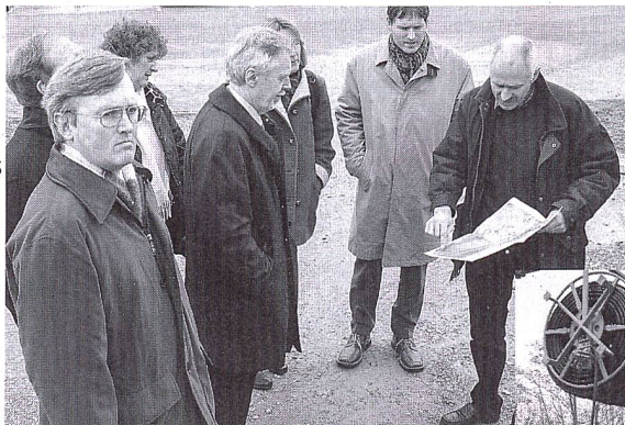
«Les Suisses sont en avance.» Des fonctionnaires du Bad-Württemberg découvrent des sondes géothermiques helvétiques.

■ Energies fossiles: Six experts internationaux étaient invités par l'Office fédéral de l'énergie à Berne le 27 février pour débattre de la future disponibilité des ressources en pétrole et en gaz naturel. Les réserves mondiales connues sont aujourd'hui estimées entre 810 et 1200 milliards de barils. Un pic de la production mondiale pourrait intervenir entre 2015 et 2025, en se basant sur les estimations fortement divergentes des ressources encore à découvrir et de l'accroissement des réserves des gisements connus grâce à une amélioration des techniques de production. La question du pic est plus importante que la date du tarissement du pétrole, car le dépassement du pic et la raréfaction des ressources entraînera, sauf réduction de la demande, une augmentation des prix. Les experts convergent aujourd'hui sur le fait qu'il va devenir de plus en plus difficile de maintenir et d'augmenter la capacité mondiale de production. La situation du gaz naturel est comparable, mais un pic est envisagé pour une date ultérieure.