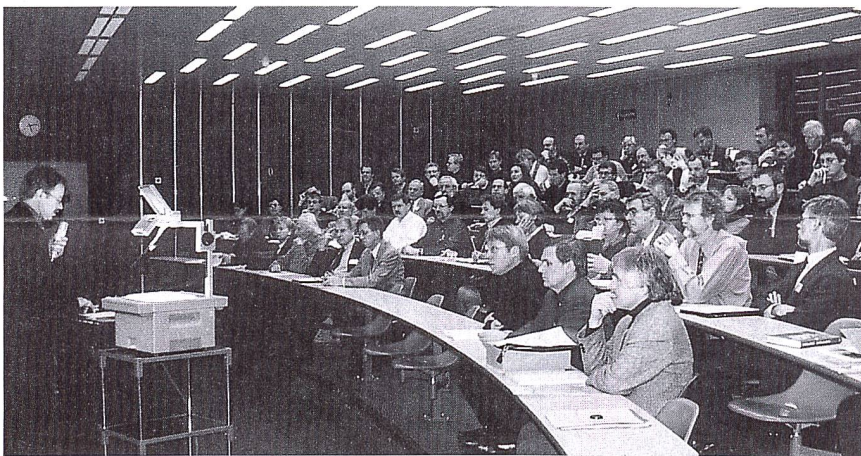
216 personnes ont participé aux cinq premiers cycles d'études postgrades de l'EPFL.

D'autres cycles ou cours postgrades, par exemple «Aménagements hydrauliques» ou «Architecture et développement durable», abordent aussi des aspects ayant trait à l'énergie. Mais notre cycle d'études est unique en son genre à l'EPFL et en Suisse – il est le seul centré exclusivement sur l'énergie et abordant ce domaine dans toute son étendue.