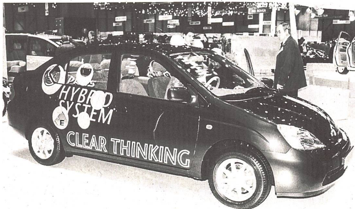
La Toyota Prius est la première voiture hybride de série. En combinant essence et électricité, elle consomme environ 5 l/100 km.