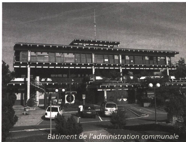
Bâtiment de l'administration communale