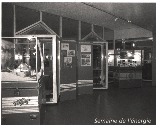
Semaine de l'énergie

L'enthousiasme des enfants qui ont eu la chance de participer récemment aux «semaines de l'énergie» dans les écoles de Crissier, renforce l'opinion que ce chemin en vaut la peine et que cette petite pierre, apportée à l'édifice, contribuera à construire un monde meilleur et durable pour nos enfants.