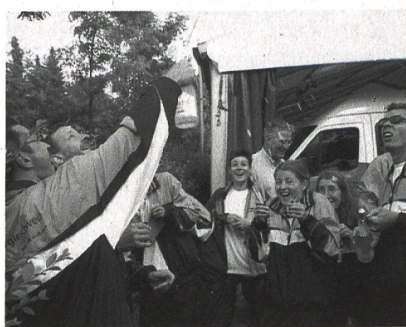
Le champagne est sabré pour fêter dignement le 29 e rang (sur 187 équipes participantes).