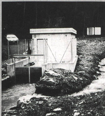
La centrale électrique de Malans (GR): les petites centrales profitent de la LME.