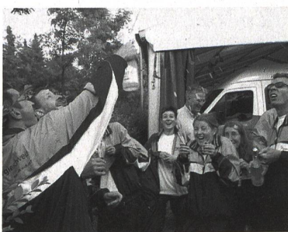
Le champagne est sabré pour fêter dignement le 29 e rang (sur 187 équipes participantes).