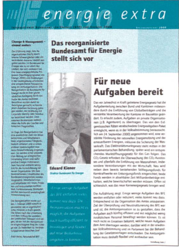
Die Spezialausgabe über die seit dem 1. Februar 2000 geltende Reorganisation des Bundesamtes für Energie ist zu beziehen bei: BFE, Sektion Information, 3003 Bern