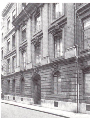
L'Hôtel-de-Ville, devenu économe

L'organisation d'une semaine d'économies d'énergie comprend notamment la pose d'appareils de mesure, un bilan des puissances et des analyses techniques. Les premières mesures sont analysées, puis le message de l'action est communiqué aux usagers qui participent à la semaine d'économies, les nouvelles mesures donnent des résultats «avant/après» qui permettront de tirer les conclusions.