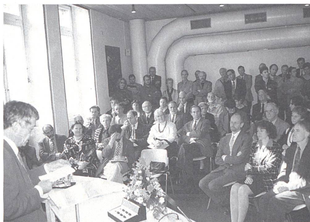
Ouverture de l'exposition L'AIR en présence du Conseiller fédéral Moritz Leuenberger.

L'exposition se prolonge par un jeu informatique permettant à chacun de mesurer son bilan en termes d'émissions de CO 2 et ses marges de manœuvre. Le CD avec le texte de l'audioguidage récité par des comédiens