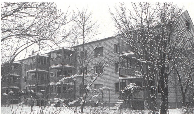
Exemple de rénovation judicieuse de bâtiments construits dans les années 60 (Soleure).