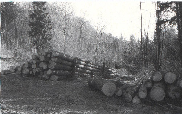
En Suisse, le bois représente la principale énergie renouvelable avec la force hydraulique.

(Extrait de la réponse du Conseil fédéral du 19 février 1997).