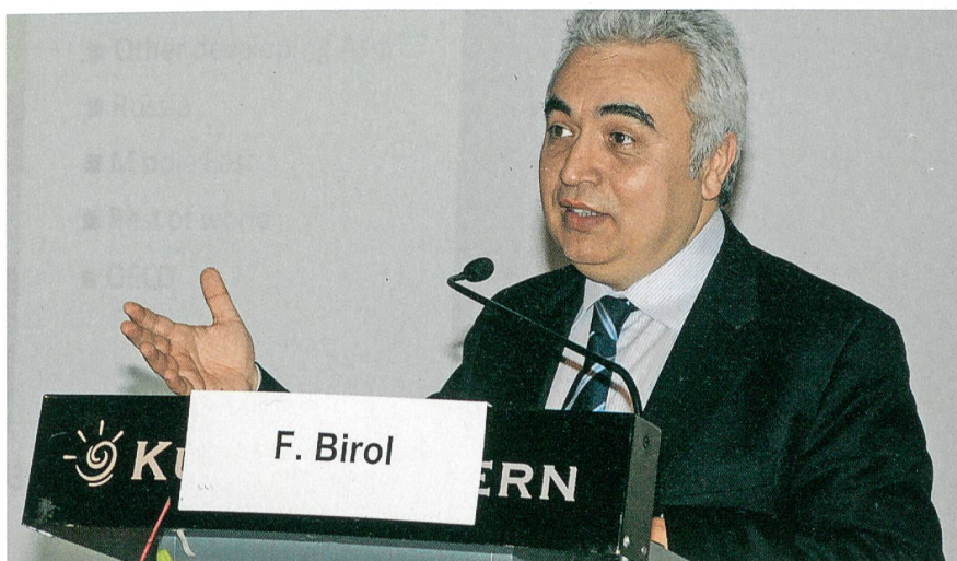
Fatih Birol, Chefökonom der IEA, anlässlich der Präsentation des «World Energy Outlook 2011» im Kursaal.