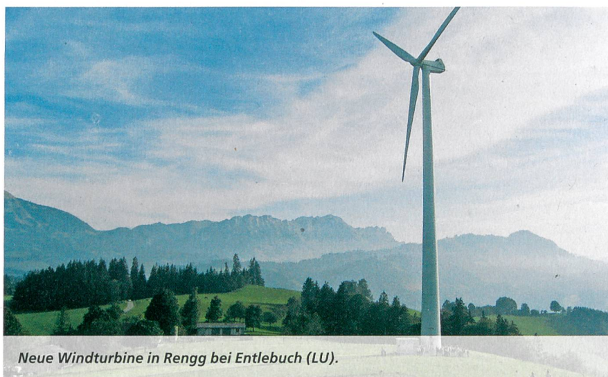
Neue Windturbine in Rengg bei Entlebuch (LU).