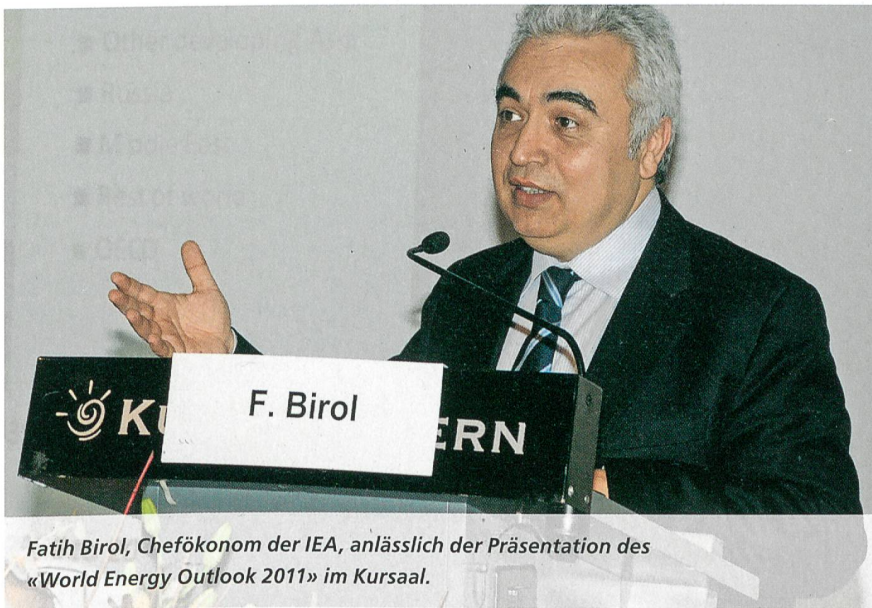
Fatih Birol, Chefökonom der IEA, anlässlich der Präsentation des «World Energy Outlook 2011» im Kursaal.