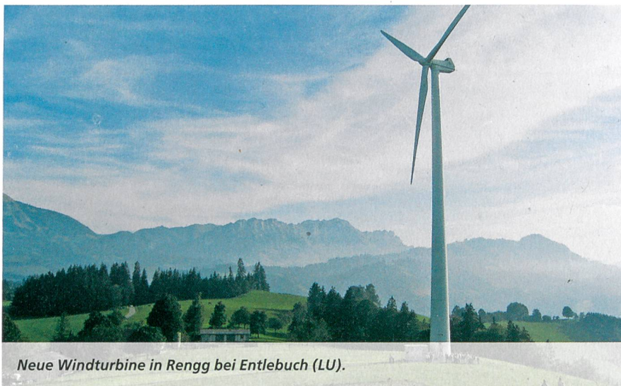
Neue Windturbine in Rengg bei Entlebuch (LU).