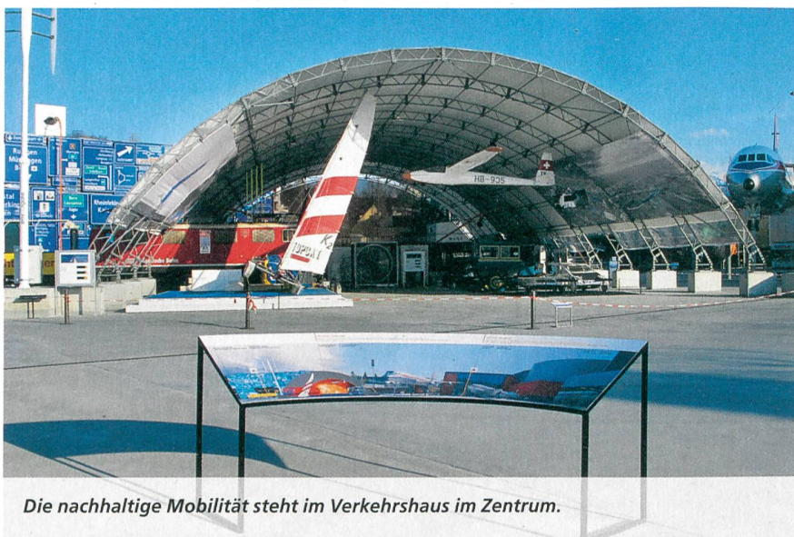
Die nachhaltige Mobilität steht im Verkehrshaus im Zentrum.