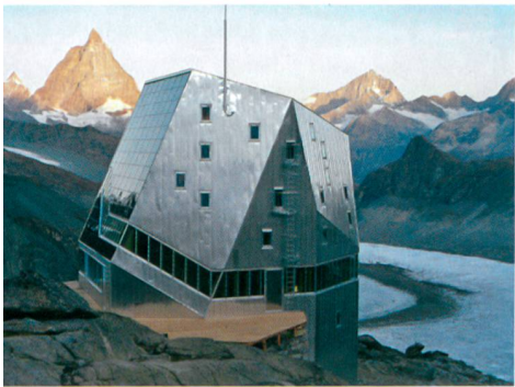
Kleines Bild: Architektonisches und ökologisches Juwel – die neue Monte-Rosa-Hütte.