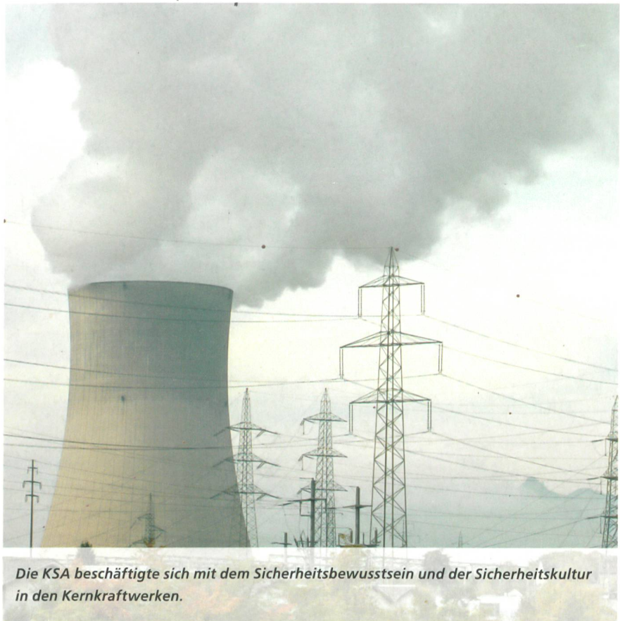
Die KSA beschäftigte sich mit dem Sicherheitsbewusstsein und der Sicherheitskultur in den Kernkraftwerken.