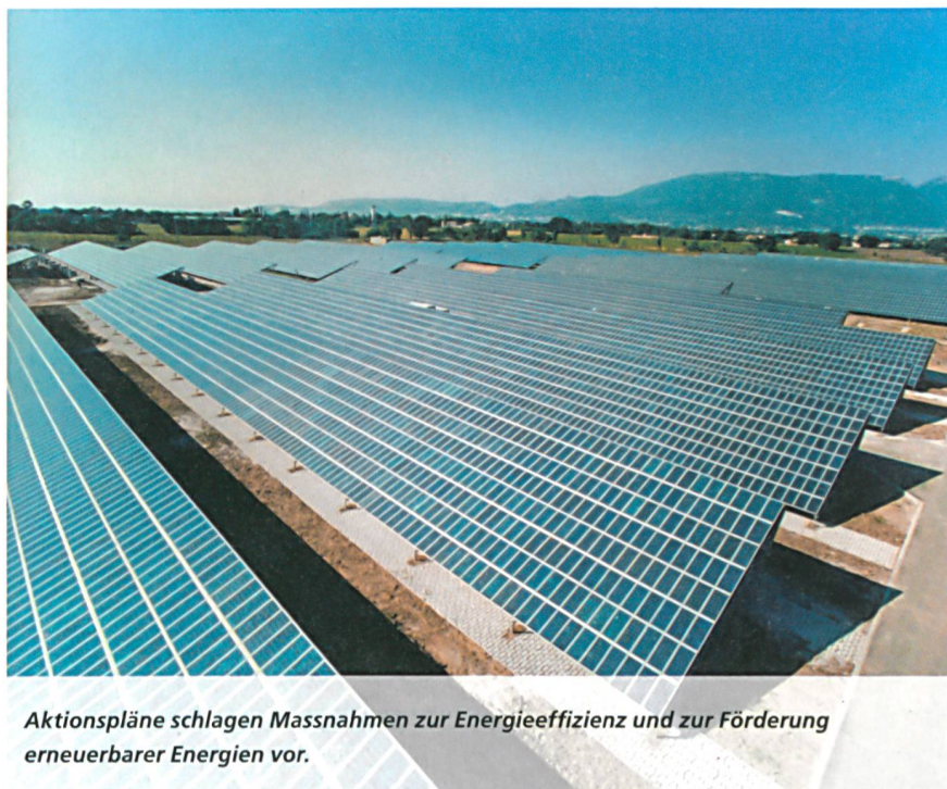
Aktionspläne schlagen Massnahmen zur Energieeffizienz und zur Förderung erneuerbarer Energien vor.