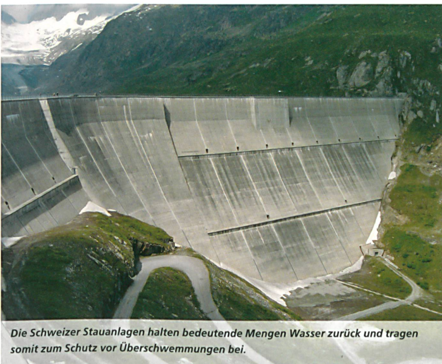
Die Schweizer Stauanlagen halten bedeutende Mengen Wasser zurück und tragen somit zum Schutz vor Überschwemmungen bei.

Marianne Zünd, Verantwortliche Sektion Kommunikation, BFE, marianne.zuend@bfe.admin.ch