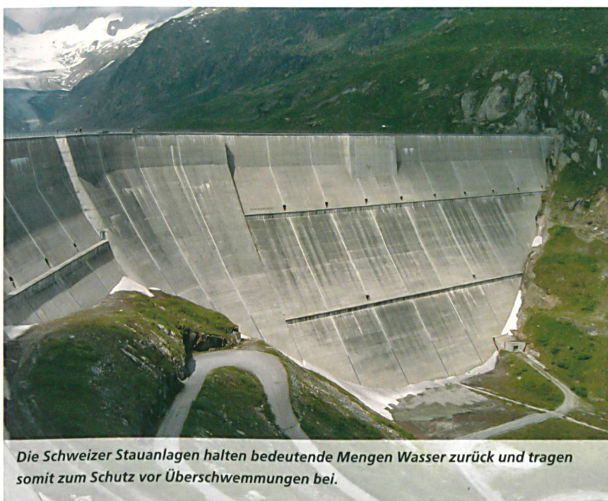
Die Schweizer Stauanlagen halten bedeutende Mengen Wasser zurück und tragen somit zum Schutz vor Überschwemmungen bei.

Marianne Zünd, Verantwortliche Sektion Kommunikation, BFE, marianne.zuend@bfe.admin.ch