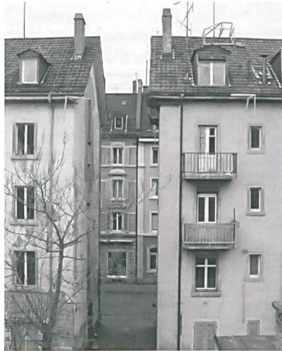
Liegenschaften Zwinglistrasse 9 und 15, Zürich: Nach der Sanierung (Bild unten) sank der Energieverbrauch für die Heizung um den Faktor 15!

Die Sanierungskosten (3,3 Mio. Franken) fielen zwar um rund 15 Prozent höher aus als bei einer konventionellen Renovation. Doch die Mieter und Eigentümer investieren nun nicht mehr in jährlich wiederkehrende, happige Energiekosten und geniessen erst noch einen höheren Wohnwert. Denn durch die Sanierung ist der Energieverbrauch für die Heizung um den Faktor 15 kleiner ausgefallen. Karl Viridén: «Pro Quadratmeter Fläche wird in diesen Bauten als Äquivalenz bloss ein Liter Heizöl benötigt; im