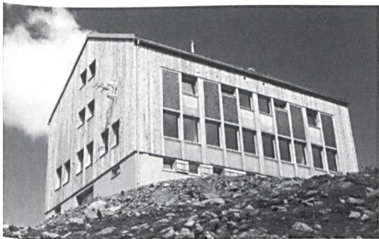
Chamanna digl Kesch, 2625 m, Schweizer Alpen-Club Architekt: Toni Spirig

In der Kategorie «Planer/Architekten/Ingenieure» bekam Architekt Toni Spirig für den beispielhaften Technologieeinsatz bei der SAC-Hütte Kesch im Albulagebiet einen Preis. Bei einem Energiebedarf von rund 38 000 kWh müssen nur 9000 kWh oder etwa 24% zugeführt werden. 76% der Energie werden an Ort erzeugt und verwendet durch Nutzung der Solarthermie, der Fotovoltaik und der Holzenergie.