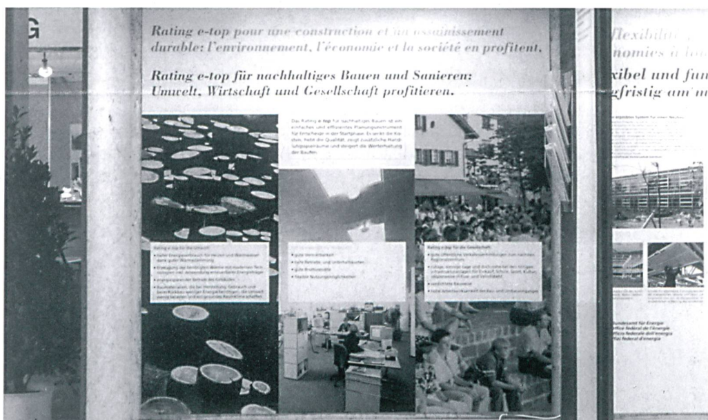
Alle profitieren vom nachhaltigen Sanieren mit dem rating e-top am Stand des Bundesamtes für Energie

Besuchen Sie auch die Sonderschau «Umwelt- und zeitgerechtes Heizen mit Wärmepumpen» Halle 5, Stand Nummer 569