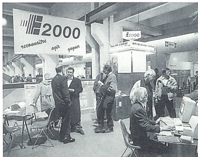
Reges Besucherinteresse am Swissbau-Stand von Energie 2000

hat sich als richtig erwiesen. Bewiesen ist auch der Erfolg der Sonderschau von Energie 2000. Die themenbezogenen Stützpunkte haben viele Besucher zu Fragen animiert. Die Multimedia Show mit den Informationen zum gesamten Energie 2000 Programm stiess auf grosses Interesse. Ebenso die parallel stattfindende Informationsveranstaltung, die von fast 200 Baufachleuten besucht wurde und zu Diskussionen anregte.