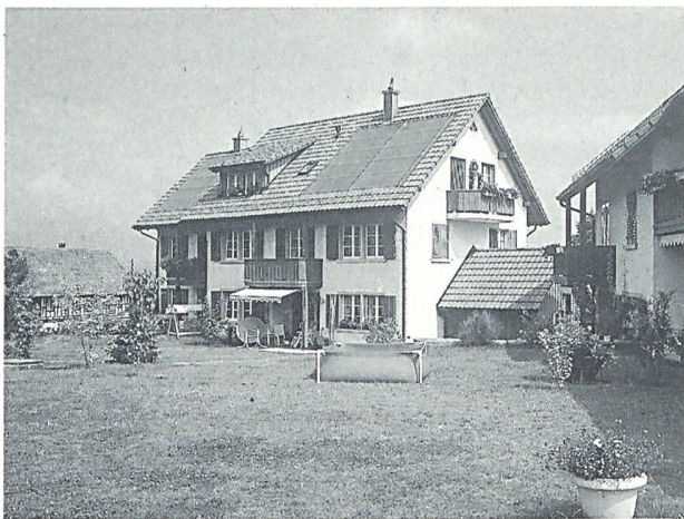
Solaranlagen für die Warmwassererwärmung sind längst erprobt.

Die Abwicklung der Förderbeitragsgesuche erfolgt über SWISSOLAR, Postfach 9, 2013 Colombier, Tel. 032/843 49 90.