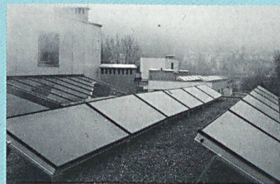
Die Solaranlage deckt 30% des Wärmebedarfs für Wasser.

Die Technik der solaren Wasservorwärmung in Mehrfamilienhäusern hat sich bereits vielfach bewährt: sie ist zuverlässig und verursacht fast keine Betriebskosten. Eine optimale Installation deckt ungefähr 30 % des Bedarfs (mit ca. 0,5 Quadratmeter Kollektorfläche pro Person) und dies zu annähernd denselben Kosten wie ein herkömmlicher Elektroboiler. Bei einer Lebensdauer von mindestens 20 Jahren dürfte die Rechnung also mehr als aufgehen. Energie 2000 fördert diese zukunftsweisende Technologie mit einer Beschleunigungsaktion des Ressorts Regierbare Energien.