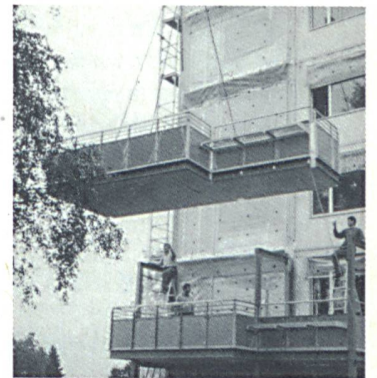
Mehr Wohnraum durch die vorge-setzten Balkone