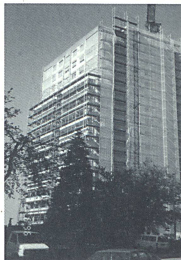
Das voll eingerüstete und gesicherte Mehrfamilienhaus

Bau- und Projektleitung: Bauconsilium, Luzern