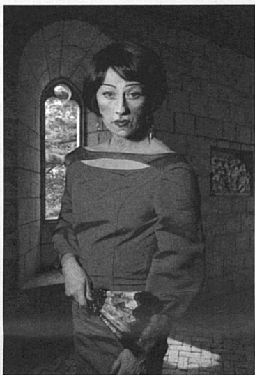
Cindy Sherman, untitled

La société assigne un rôle aux femmes et une utilité: la reproduction et les tâches qui s'y rapportent, que ce soit dans la sphère privée ou professionnelle. Après 40 ans environ, les femmes deviennent inutiles. Rester jeunes, du moins en apparence, entretient l'idée qu'elles peuvent avoir une place dans la société. Fiction ou réalité?