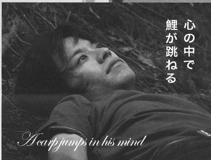
A Carp Jumps in his Mind (2005)

Les œuvres de Christelle Lheureux évoquent ainsi l'expérience humaine contemporaine, les décalages liés aux passages entre nature et urbanisation, aux déplacements culturels et géographiques, à l'aller-retour entre passé et présent, renvoyant peut-être, comme dans L'expérience préhistorique , à la nécessaire déconstruction et reconstruction personnelle qui en découle. Dans tous ses films, on retrouve les préoccupations de la vidéaste : le travail de dissociation entre le son et l'image, entre la voix et le personnage, mêlé à la superposition des textes, se double de liens et de sens parallèles permettant de créer de nouveaux narratifs. Le/la spectateur/trice peut laisser son imaginaire vagabonder et construire sa propre interprétation. Une expérience inédite et l'opportunité d'appréhender le cinéma et le réel autrement.