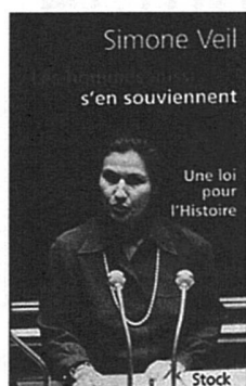
Simone Veil Les hommes aussi s'en souviennent: une loi pour l'Histoire Stock, 2004 / 112 pages / 25.60

Le 26 novembre 1974, en pleine période du MLF, une femme de courage affrontait l'Assemblée nationale française (481 hommes et 9 femmes) pour défendre le projet de loi dépénalisant l'avortement. Même ministre, même extrêmement bien préparée et se sachant soutenue par Valéry Giscard d'Estaing, le Président de la République de l'époque, Simone Veil a dû assumer durant 25 heures de débats l'hypocrisie, la mauvaise foi et même la haine de certains députés de droite, de son propre camp. «Je n'imaginais pas la monstruosité des propos de certains parlementaires, ni leur grossièreté à mon égard... un langage de soudards», raconte-t-elle aujourd'hui.