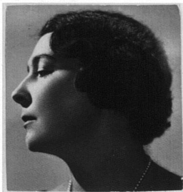
Marguerite Roesgen-Champion (Genève 1894 - Paris 1976)

Première femme en Suisse à suivre des études complètes de composition, Marguerite Roesgen-Champion travaille à Genève avec Ernest Bloch et Emile Jaques-Dalcroze (1913). Elle enseigne le clavecin au Conservatoire de Genève (1915). Elle apparaît sur la scène internationale comme claveciniste de concert et cheffe d'orchestre. Dès 1926, elle se fixe à Paris et se voue entièrement à la composition d'œuvres qu'elle interprète dans toute l'Europe. Elle participe à la redécouverte du clavecin et à l'enrichissement du répertoire de cet instrument. Certaines de ses œuvres paraissent sous le pseudonyme de Jean Delysse. Après son mariage avec un banquier parisien, elle continue à se produire comme claveciniste soliste et à composer, une liberté qu'elle se prend par rapport aux usages bourgeois.