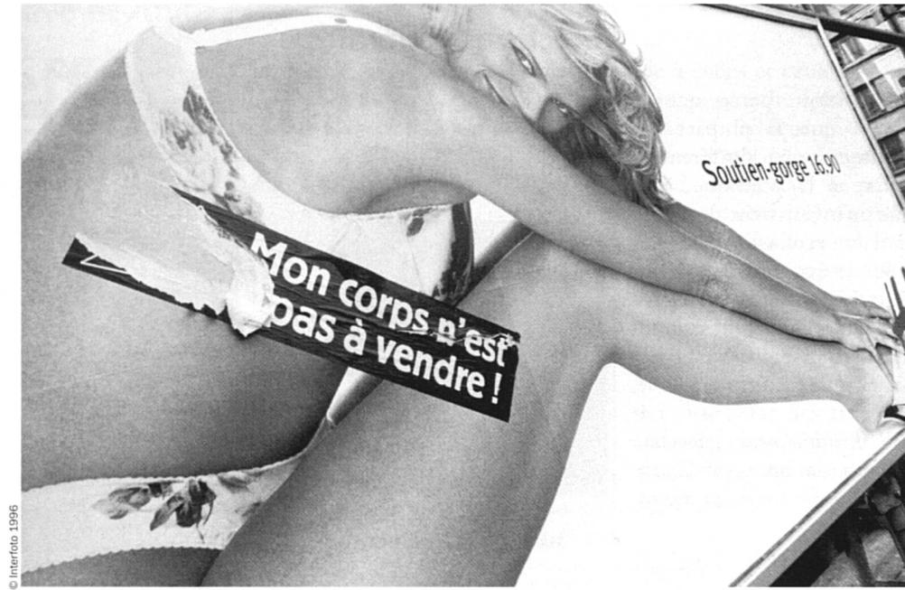
Certaines femmes font de la résistance.

Il y a quelque temps, un chœur d'hommes qui a toujours fermement refusé la mixité préparait un concert. Une villageoise pianiste l'accompagnait bénévolement pendant les répétitions et le concert. Pour fêter le succès qu'il remporta, le chœur décida de s'offrir une «virée» et invita... le mari de la pianiste. Celui-ci a accepté, sans états d'âme, rassurez-vous!