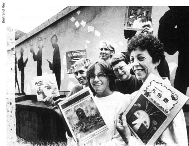
Globlivres met à la disposition de la communauté 15 000 livres représentant plus de 180 langues, tous genres confondus. Après dix ans d'existence, la démarche novatrice de Globlivres reste intacte.