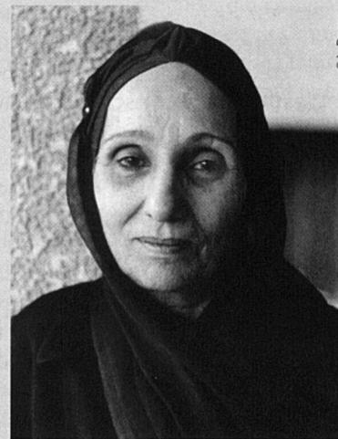
Dix ans d'embargo, les mères crient : assez !

chez les nouveau-nés, détérioration des systèmes immunitaires et digestifs, etc. Il est impossible de reconstruire les régions bombardées de l'Irak et toutes les infrastructures permettant une survie minimale sont systématiquement anéanties, comme par exemple les usines d'épuration des eaux qui ont été détruites et redétruites. Les médias, muselés et asservis, avaient présenté la guerre du Golfe comme une guerre « propre » et « chirurgicale ». Dix ans plus tard, aujourd'hui encore les bombardements américano-britanniques se poursuivent quasi quotidiennement. Des responsables humanitaires chargé-e-s de la distribution des produits achetés par l'Irak dans le cadre du programme « pétrole