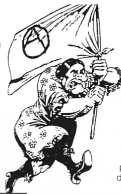
Margaret Sanger (1879-1966), rédactrice de The Woman Rebel, paru en 1914, a lancé le mouvement de contrôle des naissances aux USA.