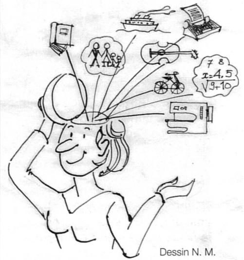
Dessin N. M.

Guide suisse bilingue, français-allemand, conseils pour recherche d'emploi, entretiens d'embauche, formations, carnet d'adresses de plus de 1'400 sociétés. Remarquable et recommandé par les spécialistes!