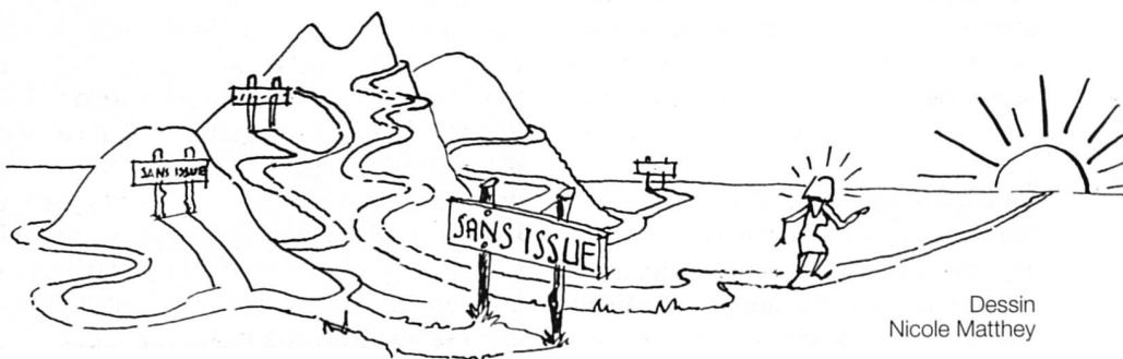
Dessin Nicole Matthey

J'ai décidé de faire un portfolio. Après un entretien préalable, j'ai choisi de l'effectuer en groupe, c'est plus stimulant. Dix-huit heures de travail collectif, réparties en 6 séances, plus deux entretiens individuels et environ 35 heures de travail personnel. Le tout sur une période de six mois.